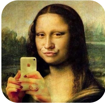
Visszaélés személyes adattal, képmással