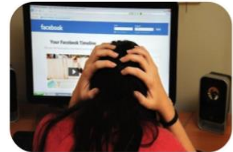
Cyberbullying (online bántalmazás, zaklatás)